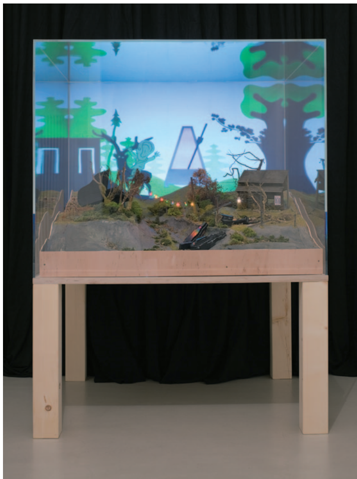
TILO BAUMGÄRTEL Metronóm, 2010, videoinstalláció, különböző anyagok, 188 × 135 × 125 cm