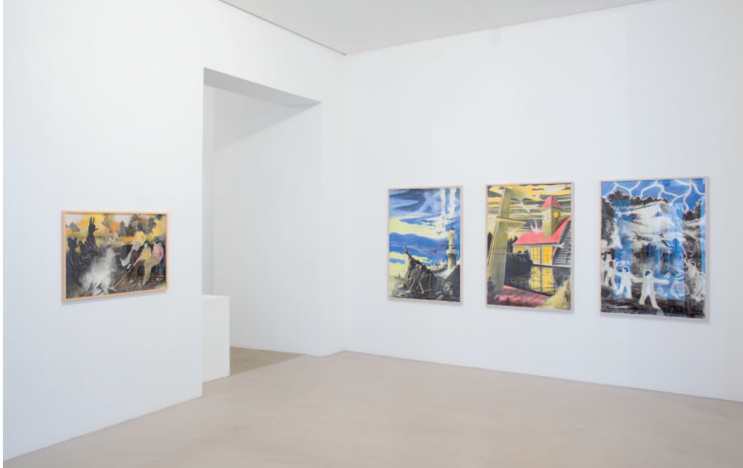
TILO BAUMGÄRTEL Ganz Ohr , Galerie Christian Ehrentraut, Berlin 2010. április 10 – június 5., részlet a kiállításról

Valójában egész egyszerű a folyamat: kivagdosom a fotókat, kézzel csinálók sok mindent, nem géppel.