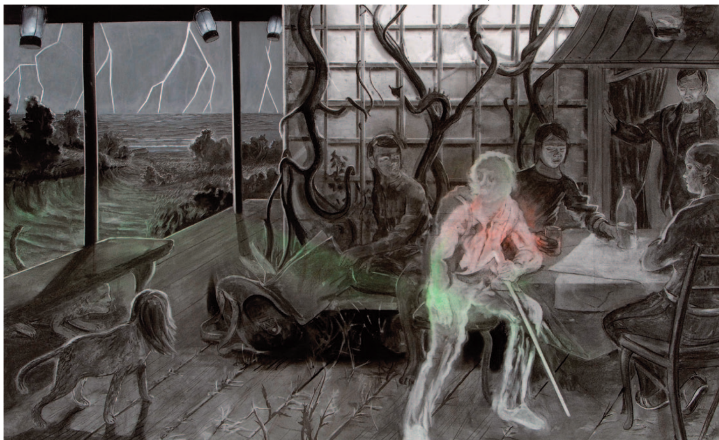
TILO BAUMGÄRTEL Világítótorony, 2006, szén, akril papíron, 150 × 250 cm Courtesy Galerie Christian Ehrentauf, Berlin; © fotó: Uwe Walter

⊗ Gyakran vannak filmes ötleteim és bosszantana, ha nem tudnám a rajzaim és a festményeim statikusságát filmben „megmozgatni”. Tudtam, hogy ezt valamikor ki kell próbálnom. Olykor látok rövid filmszekvenciákat, amelyeket jónak találok és melyek nem mennek ki a fejből. Na jó, kipróbálom én is – gondoltam. Jó módszer arra, hogy elmeséljek valamit, laza formája a dokumentálásnak. Először technikailag kellett magamat képezni. Ez itt például egy fényképezőgép, amit közvetlenül a számítógéphez tudok kapcsolni. Amikor filmet készítek, fotókat vágok ki. Filmötleteim vannak, nem konkrét forgatókönyveim, így végül is egy olyan folyamatról van szó, amelynek az eredményeképpen a kivágott fotókból jön létre a mű; afféle videoklipeknek is tekinthető munkákat készítek. Mostanában minden olyan tökéletes, számítógéppel szimulált, ezért dolgozom fotóval.