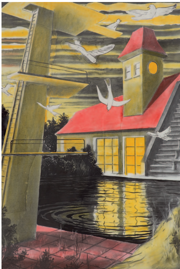
TILO BAUMGÄRTEL Tara, 2010, szén, pasztel, tus papíron, 140 × 100 cm

tek. De azok között, akik most a főiskolán tanulnak, tehát az „új-új lipcsei iskolások”, az utánunk következő generációk esetében már több a „nyugatnémet”. Azonban szerintem ez már nem olyan fontos, nincs akkora jelentősége. Nem hiszem, hogy döntő különbség lenne ma az alapján, hogy ki hol töltötte élete első 10-20 évét. Az én generációmnál még számított. Más játékok voltak, egészen más volt a szellemiség. De hogy gyarmatosítás lenne? Én ezt soha nem éreztem. Az mondjuk meglepett, hogy például Weischerre, aki Nyugat-Németországból jött, mekkora hatással volt Mattheuer. 9 Engem, aki NDK-s voltam, egyáltalán nem inspirált. És akkor mégis itt van valaki, aki NSZK-ból jön és a mi régi mesterünket jónak találja.